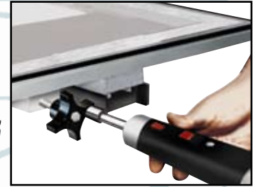
Perillas de tensión rápida

El marco de la pantalla y la base giratoria son opcionales